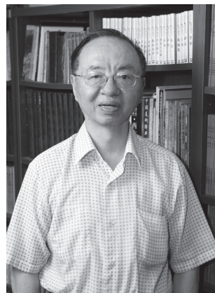
圖22 張健

張健，男，別號行健，另有筆名汶津、張虔、吳生、嘉山，1939年12月5日生於中國浙江嘉善，2018年12月16日辭世，享壽80歲。張健1948年9月間來台，畢業於台灣師範大學國文系，後再取得台灣大學中文系碩士學位。1965年，獲聘進入台灣大學中文系任教，擔任講師，至1975年升等為教授，2002年自台大中文系教職退休後，轉任中國文化大學中文系教授。張健除了在此兩所大學任專任教授之外，也曾於中山大學、淡江大學、彰化師範大學、台北藝術大學擔任兼任教授，並曾任香港新亞研究所、香港珠海書院、武漢中南財經政法大學新聞傳播學系、馬來西亞新紀元大學學院中國語文學系、香港廣大大學院、金華浙江師範大學中文系、香港嶺南大學等校訪問教授，以及應邀至中央研究院中國文哲所講學。張健在學術上專長於中國文學批評、詩論以及現代文學研究，除長年在學院內從事教學與研究工作之外，還曾擔任《中國時報》專欄作家、《藍星》詩刊與《海洋》詩刊主編，《現代文學》編輯委員、中華民國比較文學學會理事與監事、中國青年寫作協會理監事、國際東方詩