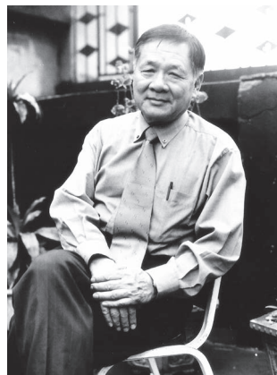
圖25 痾弦

痾弦，男，本名王慶麟，別號明庭，1932年9月29日生於中國河南，2024年10月11日辭世，享耆壽92歲。1949年隨軍來台，考入於政工幹部學校影劇系，後取得美國威斯康辛大學東亞研究所碩士學位。1966年應邀赴美國愛荷華大學「國際寫作計畫」研習2年。曾任教於中國文化大學、東吳大學、國立藝術學院等。曾任《幼獅文藝》主編、幼獅文化公司總編輯、華欣文化中心總編輯、《聯合報》副刊主編、副總編輯兼副刊組主任、《聯合文學》月刊社長等職。曾獲軍中文藝獎詩歌組優勝獎、中華文藝獎長詩獎、藍星詩獎、救國團青年文藝獎、十大傑出青年、香港現代文學美術協會新詩獎、金鼎獎、副刊編輯獎、五四獎文學編輯獎、台北文化獎等。辭世後獲頒總統褒揚令，以示政府篤念魁彥之至意。