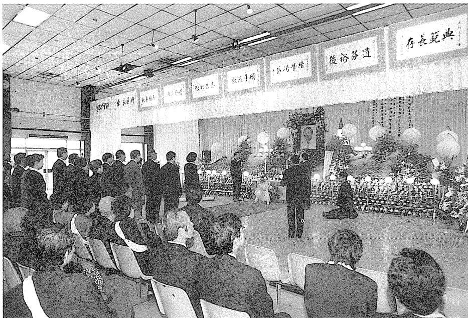
詩人梅新追思會 詩人梅新遽逝，眾文友前往悼念。

梅新驟逝，文壇咸感驚訝，除梅新擔任社長的現代詩社出版紀念專輯外，在友人的協助下，梅新最後詩集