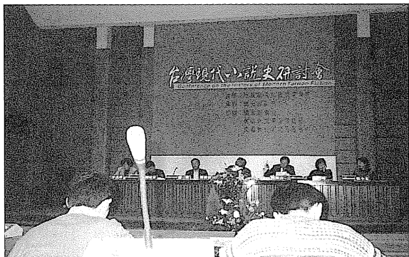
台灣現代小說史研討會 由文建會主辦，聯合報副刊承辦之「台灣現代小說史研討會」於12月24～26日舉行。

由文建會主辦、聯合報副刊承辦、國家圖書館、聯合文學雜誌社及文藝資料研究服務中心協辦的「台灣現代小說史研討會」，自一九九七年十二月二十四日起，一連三天，假國家圖書館會議廳舉行。會中計發表二十五篇論文，資深作家齊邦媛、葉石濤發表專題演講，並舉行一場座談會，為近年來對台灣現代小說家的作品論述規模最大的學術研討會。