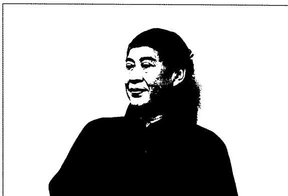
「作家身影系列」—白先勇