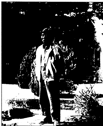
「作家身影系列」—鍾肇政