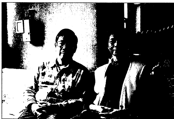
「作家身影系列」—鄭清文與夫人合影