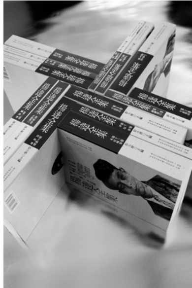
圖6 楊遠全集編譯委員會，《楊遠全集》。