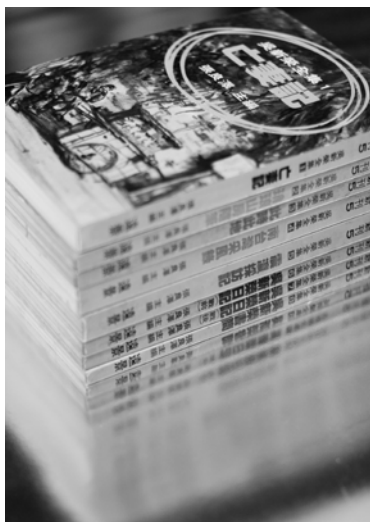
圖4 張良澤主編，《吳新榮全集》。

70年代中期後，《鍾理和全集》（8冊，台北：遠行，1976）、《吳濁流作品集》（6冊，台北：遠行，1977）、《七等生小說全集》（10冊，台北：遠行，