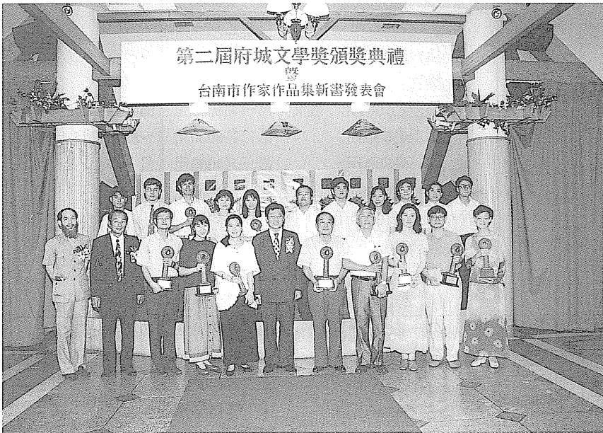
由台南市立文化中心 主辦的「府城文學 獎」。