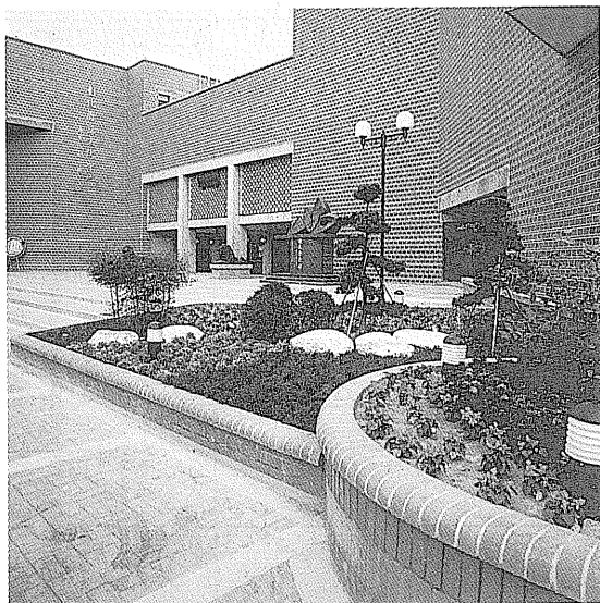
彰化縣立文化中心