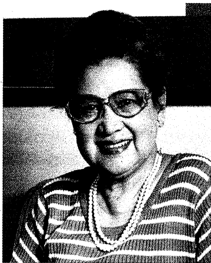
圖 81 永遠的冬青樹——林海音。

一個是北平，雖然她回到了故鄉，卻一直對另一個故鄉念念不忘，也因此寫了許多作品來緬懷，帶動了懷鄉文學的熱潮，大家耳熟能詳的《城南舊事》就是她以北平生活的點點滴滴所寫成的，而她平實自然，筆觸細膩的寫作風格也為當時的文壇注入一股清流。身兼作家、副刊和雜誌編輯，林海音致力提攜後進，拔擢人才，使他們有發表的園地，並聯合一些出版同業，定期交流互換資訊，率先出版在當時屬於禁書的中國當代文學作品，帶動潮流，也帶給台灣文壇一些刺激和不同的聲音。林海音這種以開闊的心胸和寬廣的格局去面對當時壓迫的台灣社會，超越地域和省籍的藩籬，