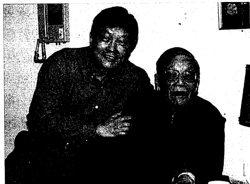
圖73 一代大師王夢鷗，一生奉獻教育、文學創作及漢學研究，不但著作等身，而且桃李滿天下。（左 林明德、右 王夢鷗）

王夢鷗（1907~2002）老師一生圓滿，離開我們了。認識王夢鷗老師已有三十多年，記得當時，台大中文系主任屈萬里教授敦聘王老師講授「中國文學批評史」，我在輔大中文系新任講師，好友陳萬益、李豐楙分別在台大、政大博士班深造，大家相約旁聽王老師的「新課」。老師已過耳順之年，學養深厚，專題論述，旁徵博引，講者興會淋漓，聽者心領神會。下課後，我們陪老師走過椰林大道、送他上公車。這一段美麗的回憶，也是了解老師風範的開始。