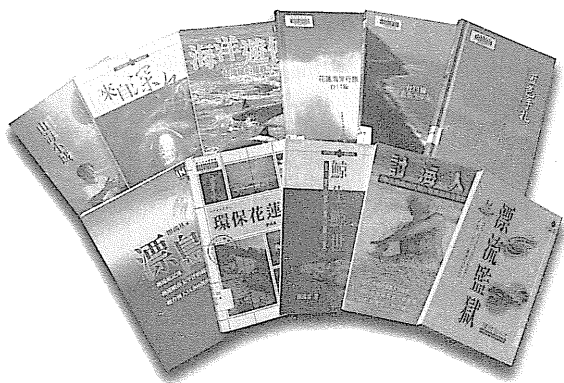
圖 44 廖鴻基作品書影。

內外環境是文學創作的母土，除了陸地外，海洋理應是島國重要的文學資源，廖鴻基踏臨這個領域，並綻開了台灣海洋文學面向的無限可能。