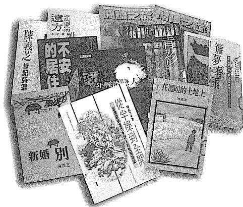
圖 46 陳義芝作品書影。

無論曾經獲得哪些獎項，2003年榮後台灣詩人獎的再次肯定，讓陳義芝背負更大的重任，他要不顧一切超速前進，繼續創作動人的詩篇。