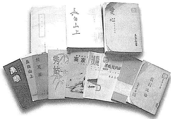
圖 48 王生善作品書影。

劉 俠(1942.2.8~2003.2.9)，筆名杏林子，散文作家，陝西扶風人。1949年隨家人來台，台北市北投國小畢業。曾任內政部傷殘服務中心顧問、南機場社區發展中心輔導、伊甸殘障福利基金會負責人、教育部特殊教育委員、中華民國殘障聯盟理事長、總統府國策顧問。