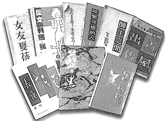
圖60 王藍作品書影。

1979年應聘為美國俄亥俄州立大學藝術系暨東亞文學系客座教授後，定居美國，2003年10月9日，病逝於洛杉磯，享年81歲。