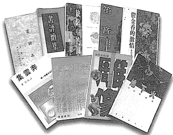
圖64 司徒衛作品書影。

會，具有「靜思而遠颺，靜觀而熱誠」的風格。作品有《奔雲集》（1982）、《靜觀散記》（1987）、《鬱金香的激情》（1989）、《雕像》（1990）、《地下火》（1990）、《笛音壺》（1992）及《缺陷中的圓滿》（1994）。10月27日病逝於美國，享年82歲。