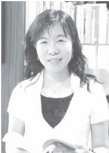
圖 33

目前任教於台灣大學台文所的黃美娥教授（1963-），以《重層現代性鏡像：日治時期台灣傳統文人的文化視域與文學想像》（台北：麥田，2005）榮獲2006年「巫永福文學評論獎」，獎金10萬元。