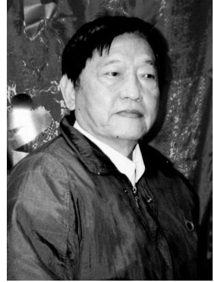
圖31 高前

高前，男，本名高寶忠，別號鑑知，1925年6月14日生，籍貫中國河北省任邱縣。高前畢業於南京市戲劇專科學校、政工幹校康樂班，1948年間來台，曾任國防部康樂總隊編導、副主委，藝工總隊演劇隊長，青溪新文藝學會理事，台灣電視公司編劇、製作等職。高前為著名劇作家，其作品類型橫跨舞台劇、廣播劇、電視劇，高前24歲就寫下歷史大戲〈鄭成功〉，在台灣各地巡迴演出達百場之譜。60年代，台灣的電視公司相繼成立，高前即為台灣最早的電視編劇與製作人之一，也曾以90分鐘電視單元劇〈吾愛吾師〉為台視贏得金鐘獎，話劇〈性本善〉獲得國軍文藝金像獎最佳編導獎，廣播劇〈女強人〉、〈生命的光輝〉為漢聲電台奪得最佳戲劇節目金鐘獎，以〈牆頭記〉榮獲金鐘獎最佳編劇獎。此外，高前亦曾榮獲國軍新文藝金像獎，中國文藝協會文藝獎章。高前於2010年10月12日過世，享壽85歲。