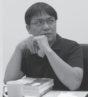
圖11 吳明益 攝影／吳奕圻