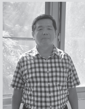
圖12 宋澤萊