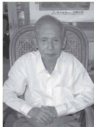
圖26 陳冠學

陳冠學，男，1934年2月1日生於屏東新埤鄉，原籍日治時期北門郡（今台南縣學甲、佳里、將軍及北門一代）。陳冠學畢業於台灣師範大學國文系，曾任國中、高中、專校教師，曾於屏東潮州開設印刷廠，並擔任高雄三信出版社總編輯一職。1981年辭去教職，暫居高雄澄清湖畔，1982年搬回屏東新埤老家萬隆村，晴耕雨讀，專職寫作。1983年，陳冠學以《田園之秋》獲得第6屆時報文學獎散文推薦獎，1986年獲得吳三連文藝獎，1999年獲文建會「台灣文學經典三十」散文類推薦，2003年榮獲鹽分地帶台灣新文學貢獻獎等，作品多編錄於國高中教科書內，晚年曾多次婉拒推薦為國家文藝獎人選。2011年7月6日因病過世於屏東基督教醫院，享年77歲。