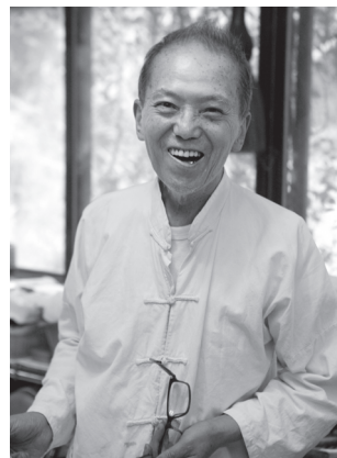
圖28 楚戈

楚戈，男，本名袁德星，1932年3月23日生，籍貫中國湖南省汨羅縣，藝文界暱稱「袁寶」。9歲學習《左傳》與《詩經》，17歲從軍，1949年以戰二營修理所一等兵身分隨軍來台，1950年代接觸現代詩創作，1957年起，陸續參與紀弦「現代派」、「五月畫會」、「東方畫會」，遂以「楚戈」為名創作。1962年，歸依佛門，主編《獅子吼雜誌》。1966年退役後，楚戈考取國立藝專夜間部。1967年被聘任為文化學院「藝術概論」、「中國文化概論」課程講師。1968年進入故宮博物院器物處，從事商周銅器鑑定工作，與著名書畫篆刻家江兆申並譽「故宮二寶」。1981年診斷罹患鼻咽癌後，仍未放棄創作，期間多事繪畫、書法、寫作、藝術創作，自喻「再生的火鳥」，多次於國內外舉行個展，曾榮獲2007年中山文藝獎。2011年3月1日因鼻咽癌導致多重器官衰竭，過世於台北榮總，享壽80歲，辭世後獲頒總統褒揚令，表彰其在文學與藝術領域的卓越貢獻。