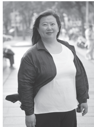
圖34 韓良露

韓良露，女，1958年11月19日生於高雄市。2015年3月3日，韓良露因子宮內膜癌病逝於台北榮民總醫院，享年57歲。韓良露自幼在台北長大，至高中三年級曾短暫轉學至台南女中，但不久旋即休學，以同等學歷考取台灣師範大學，畢業於台灣師範大學歷史學系。大學畢業之後，韓良露投身媒體，從事電視影集劇本寫作，並開設製作公司，製作過多部電視影集。1990年間，韓良露隨夫婿一同移居英國倫敦求學生活，並遊歷世界各地，至1998年返台。韓良露活躍於藝文界，曾擔任紀錄片導演、台北飛碟廣播電台主持人、林語堂故居及錢穆故居督導、富邦講堂和誠品講堂講師、資訊公司總經理等職務。2007年，韓良露與趨勢科技公司共同創辦人陳怡蓁在台北市師大商圈創辦「南村落」文化基地，以社會企業的模式，舉辦各式講座與展覽，並著重於美食文化的推廣。曾獲金鐘獎最佳新聞節目、行政院新聞局優良電影劇本獎、台北文學獎文學年金等，2013年，因「南村落」經營有成，帶動台北發展巷弄美學、在地文化，韓良露獲頒「台北文化獎」個人獎，並被譽為「城市的文化魔術