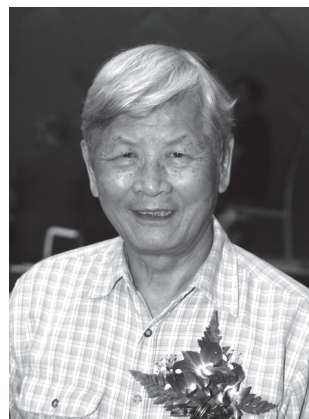
圖30 楊南郡

楊南郡，男，1931年11月28日生於日治時期台南州新豐郡龍崎庄（今台南市龍崎區），2016年8月27日凌晨病逝於台大醫院，享壽85歲。楊南郡於1944年被召集到日本神奈川縣海軍兵工廠，成為台籍少年兵，負責維修製造神風特攻隊的靈式戰鬥機，當時他未滿14歲。日本投降後，楊南郡回到台灣，從台南二中畢業並進入台灣大學外文系就讀。畢業後擔任英文教師兩年，再到台南美國空軍基地和美國駐台辦事處任職，期間接觸登山活動進而引發興趣。