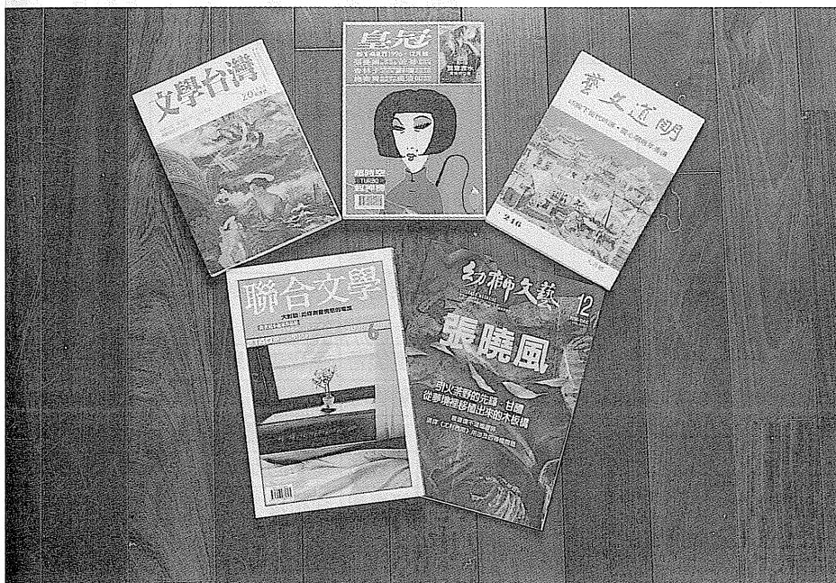
文學雜誌在小說的發表上扮演重要角色。