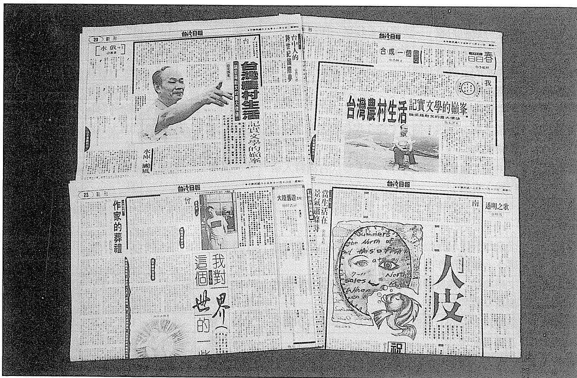
台灣的報紙副刊是文學評論的主要發表園地