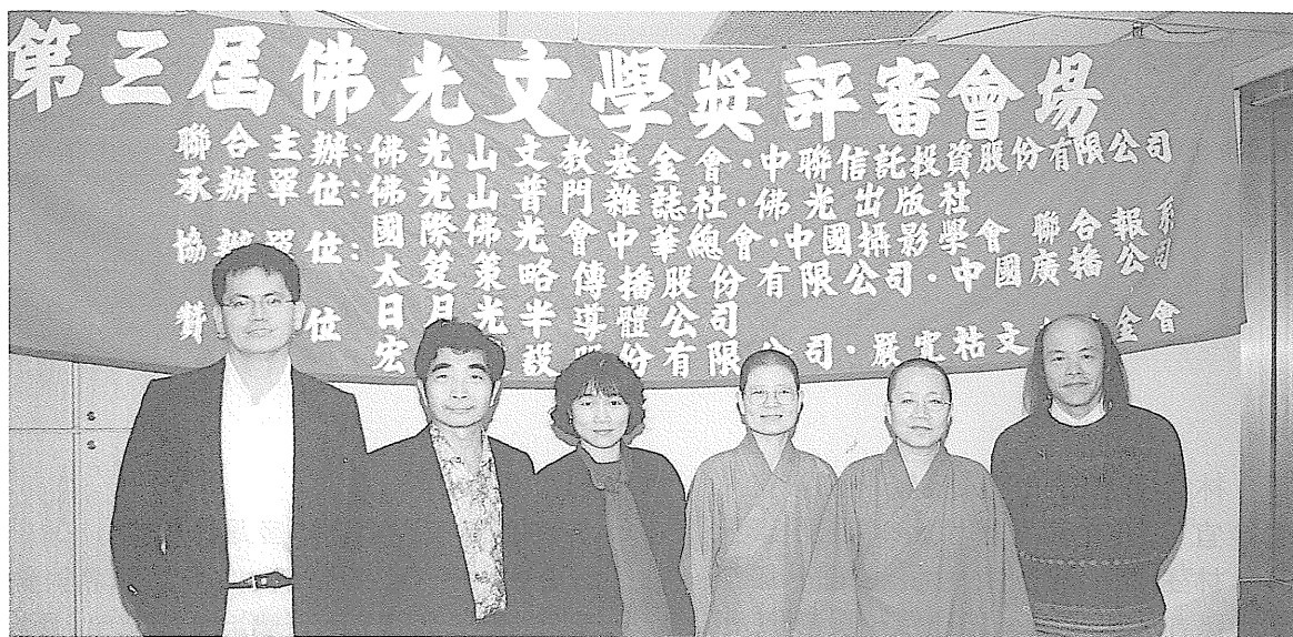
第三屆佛光文學獎評審會場。(普門雜誌社提供)