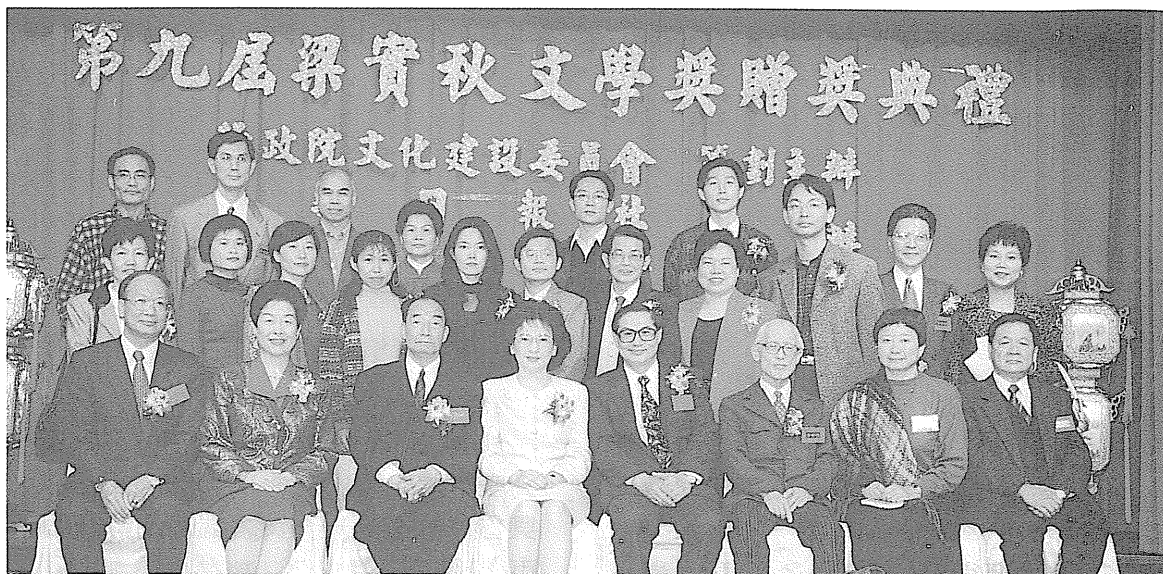
第九屆梁實秋文學獎贈獎典禮。