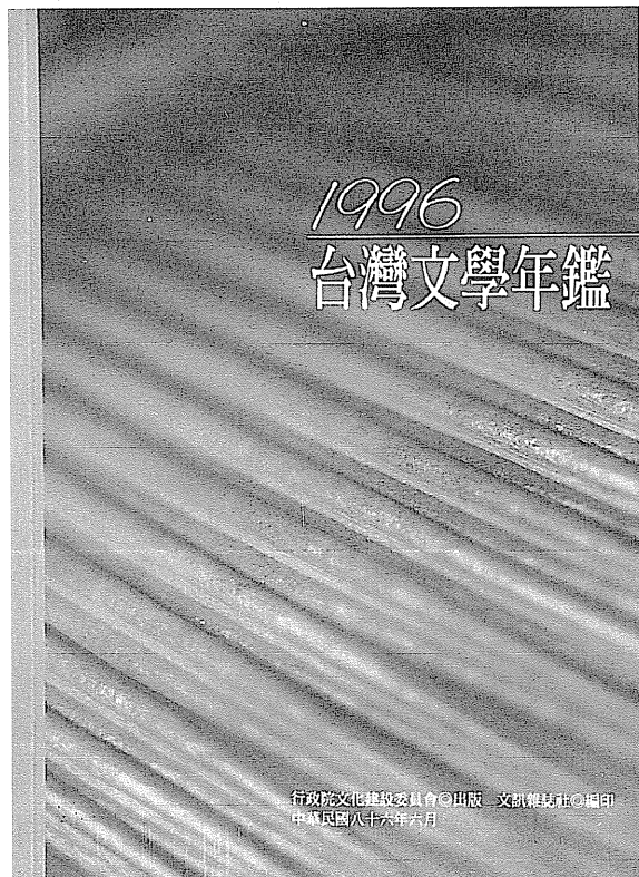
1996 台灣文學年鑑 / 行政院文化建設委員會 / 六月

繼《一九六六中國文藝年鑑》、《一九六七中國文藝年鑑》和《一九八〇年中華民國文學年鑑》，隔了十六年，第四本《一九九六台灣文學年鑑》誕生了，希望往後能夠年年編下去，才不會使這座文學