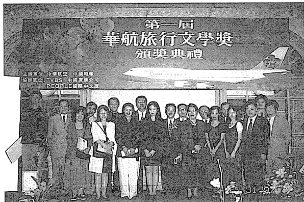
第一屆華航旅行文學獎。