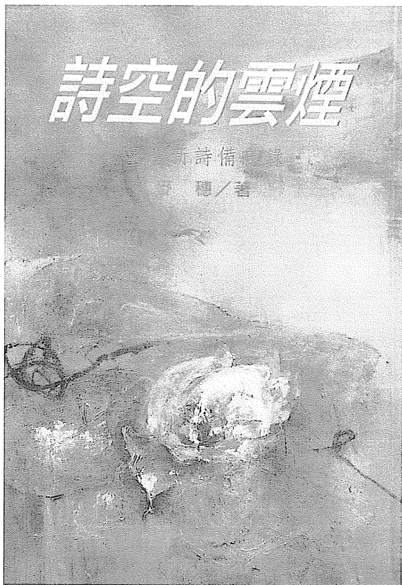
詩空的雲煙／詩藝文／四月

畢生致力新詩史料的蒐集與保存，麥穗較之五十年代同時期崛起的新詩人，著實付出了更多的愛心與血汗。有人稱他是「早期新詩史料的撞鐘人」，並非過譽。無怪乎痲弦為《八十六年詩選》寫序時曾特別建議：「台灣如果有一個詩的專題圖書館，最理想的館長人選，應該是麥穗」。他說這番話絕非客套，而是突顯他對當代新詩史料具有一份相當深沉的使命