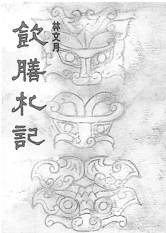
飲膳札記／洪範／四月

電影「飲食男女」細細講究菜肴的品賞與調理，從此，原來以一般家庭實際應用為主要訴求的食譜與料理節目，轉變為生活情趣的嚮往與創造，加上遂耀東、唐魯孫多年來默默寫作，以文字追念逐漸消逝的飲食文化之美，飲食熱潮終於成爲一個巨大的浪頭。《飲膳札記》一書，在這樣的大浪裡，並未成爲過江之鯽，反而另有獨特的風韻。