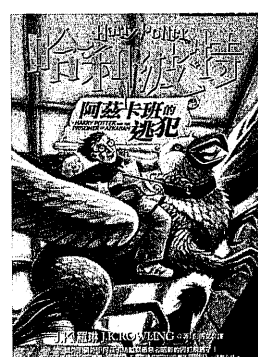
圖 97 《哈利波特》跳脫文字，繼續在台發揮魔法魅力。