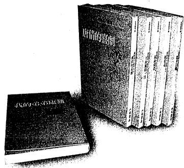
圖 95 睽違十三年《陳映真小說集》由洪範出版社再度出版。

當郝譽翔在訪談中問及為何重新提筆，以及對文學的期望如此等問題時，陳映真表示：「我最感到快樂的還是創作。再者，我已經超過六十歲了，對以後十年的生活需要有所規劃，轉眼七十就要到來。這時又看到我的好友黃春明重新發表作品，對我當然是很大的鼓舞。最後，則是對年輕一輩創作的關心。……我希望透過實際的創作，看看現實主義還有沒有路可以走？因為文學不能光靠理論，還是寫了才算數，必須透過作品的考驗。」(《聯合文學》，111期)。由上述回響及作家現身說法，可一窺這位被譽為「永遠的薛西弗斯」、「最後的烏托邦主義者」等的小說家陳映真，從早期懷抱著理想主義至今不滅的心靈面貌。