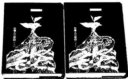
圖81 鍾肇政的《台灣人三部曲》，是台灣大河小說的先驅。

2003年年底，桃園縣文化局將主辦一場「鍾肇政文學國際學術研討會」，所提論文以及編輯小組擬編的〈鍾肇政八十大壽紀念文集〉，將是全集第35冊別卷