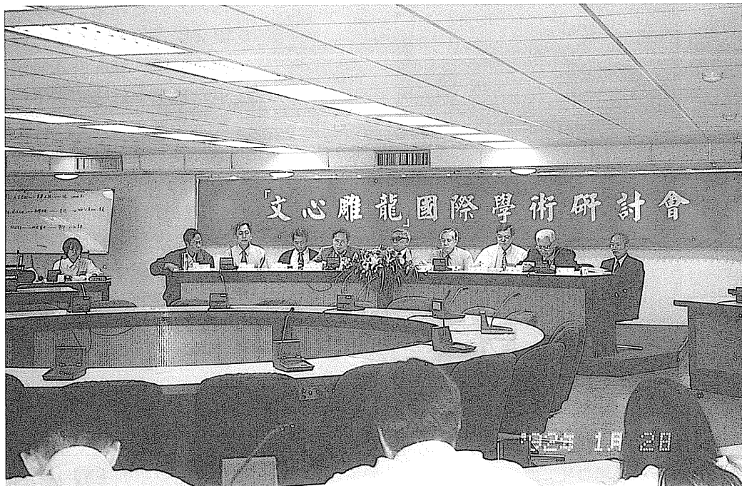
文心雕龍國際學術研討會 由國立台灣師範大學國文學系、中國語文學會合辦的「文心雕龍國際學術研討會」。

近年大學開放設立，與中國語文學有關的碩士班已有二十餘所，博士班也有十三所。今年完成的博碩士論文估計有二八〇篇，其中屬於古典文學的一二一篇，約佔百分之四十三。這些學位論文顯然成爲一項可觀的研究成果。同時，許多學校規定研究生在提交畢業論文之前，必須先行發表一至二篇論文做爲資格審核