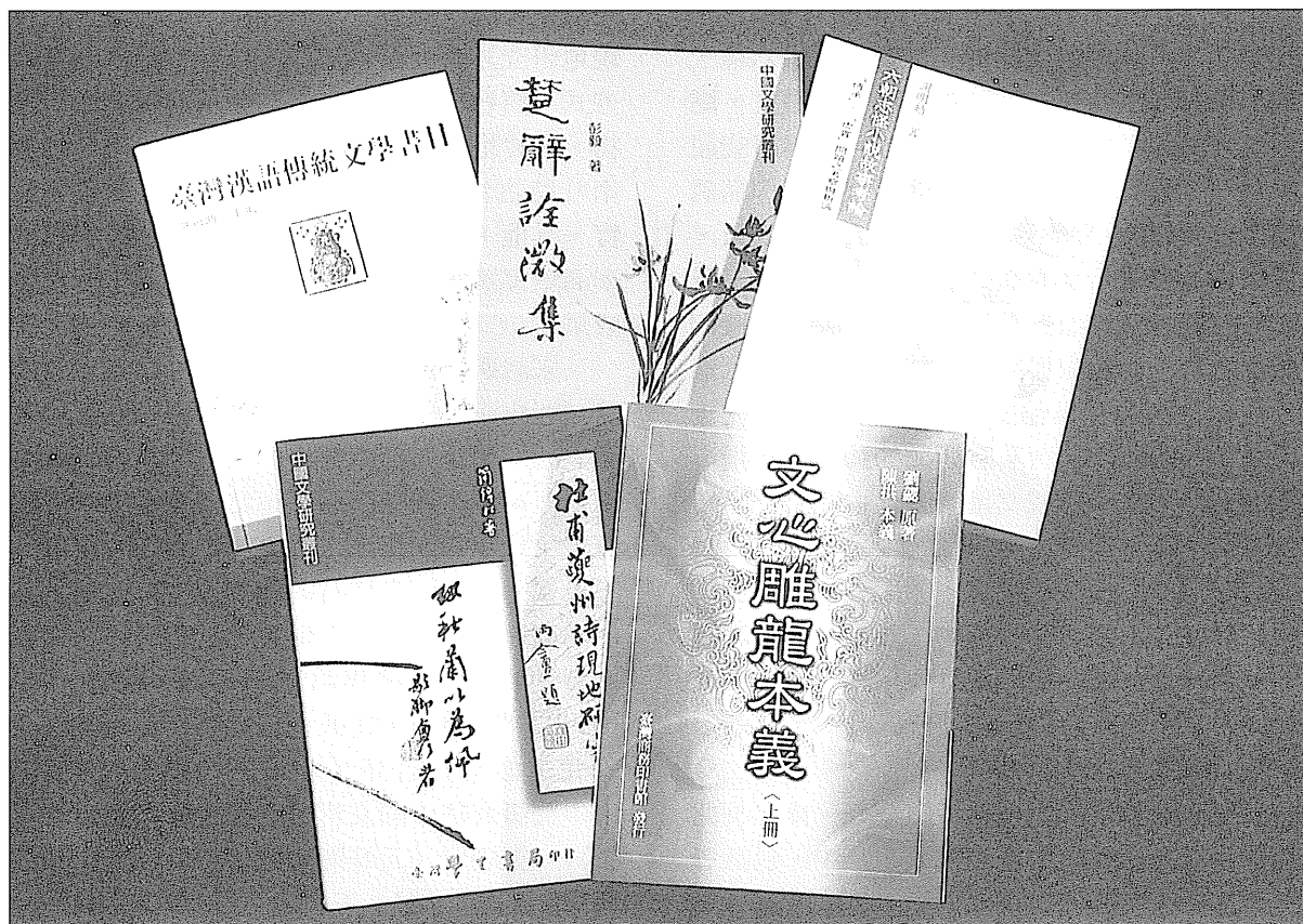
古典文學研究論著 古典文學的研究成果頗為可觀。

戲劇研究方面，十分熱鬧。曾永義教授《增訂明雜劇概論》（台北，學海）是二、三十年前博士論文的局部修訂重排；另撰有〈也談「北劇」的名稱、淵源、形成和流播〉（《中國