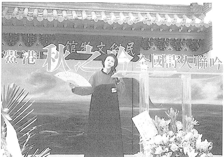
全國詩人聯吟大會 由基隆市詩學研究會舉辦的東北七縣市秋之吟全國詩人聯吟大會。

北七縣市秋之吟全國詩人聯吟大會，並於會中舉辦正式吟唱比賽，在民間聯吟活動是為首例，甚為突出。而台灣這幾年為保持各族群母語文化，近兩年仿照國語文競賽，舉辦含有台灣鄉土語文的競賽，八十七年由新竹主辦、今年由彰化接手、八十九年則預定在台南縣舉行，其中便設有古典詩吟唱一組。未來地方文藝活動或民間聯吟將古典詩吟唱設為正式比賽項目，或是可以觀察的方向。另外，值得擔心的是：這種趨勢，是否會造成喧賓奪主的情況，參與者將吟唱獲獎視為唯一的目標，而把創作當作可有可無？像每年定期舉辦的「大專