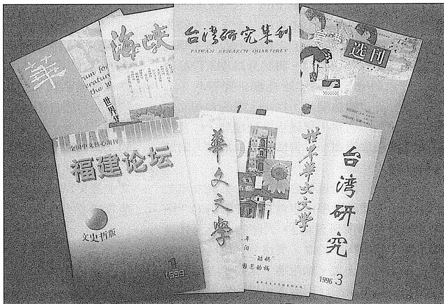
大陸的台灣文學研究刊物 大陸刊登台灣文學評論文章的各類雜誌越來越多。