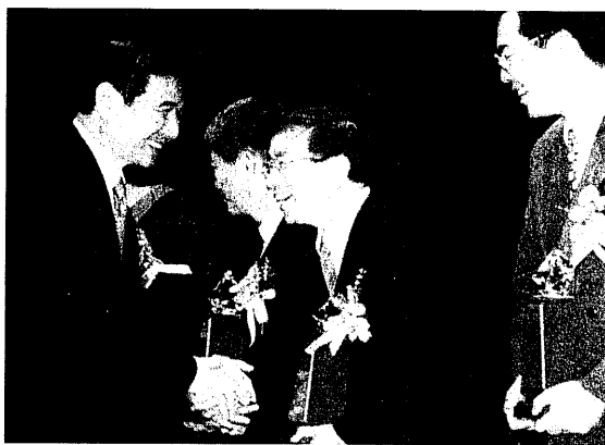
圖43 第八屆東元科技獎頒獎典禮。