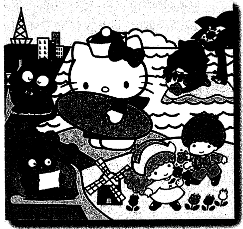
圖10 日、韓流行文化透過媒體，風靡台灣年輕族群，引發一股消費的狂熱，流行語稱之為哈日、哈韓。

重：成功大學原就有優秀的科技傳統，加上南部科技園區的成立，學生可以有較好的科技薰陶，尤其電腦的普及、網際網路的發展，新世代的文科學生一定要掌握現代科技，並面對社會的需要，以習得應有的知識與能力、服務社會。就此本系將加強文學與媒體的探討與訓練（如網路文學），亦將設計廣告文學的學程，增加學生的社會競爭力。