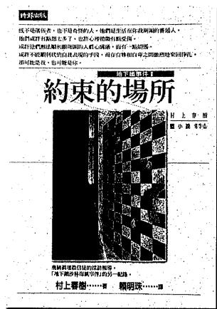
圖11 受到哈日、哈韓風氣的影響，台灣的出版界也瀰漫著一片日、韓情調。