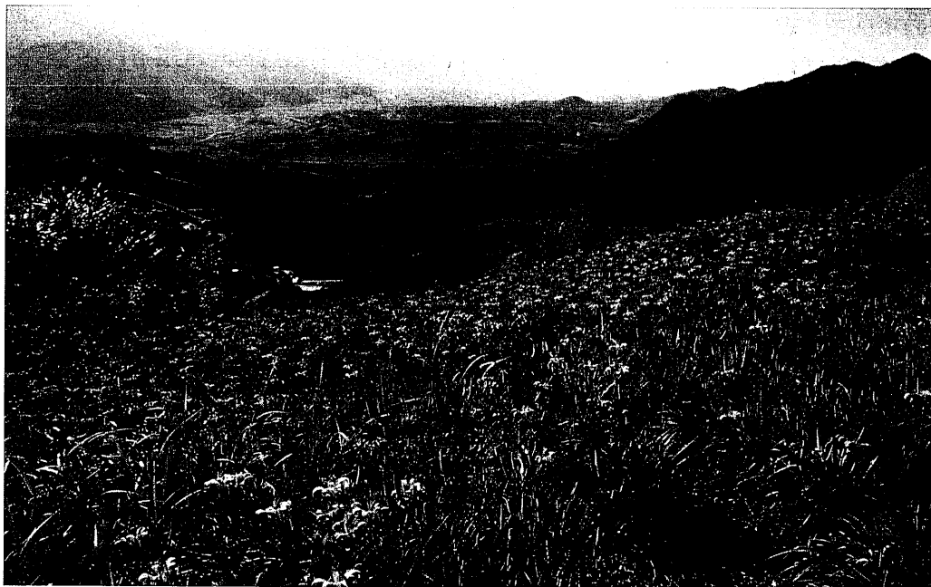
圖28 後山，像未開的礦脈，或正在琢磨的璞玉，渾厚雄偉的自信，一切令人期待。

作群」，1994年3月改組「後山文化工作協會」，十年之間，成員合力完成地方文史資料共有：《後山代誌》五冊、《台東縣老照片專輯》二冊、《台東縣寺廟專輯》、《台東縣老樹專輯》、《台東縣耆老口述資料》各一冊，及《龍田記事》、《加走灣記事》、《太麻里記事》三本鄉鎮文史資料等。終於2002年9月28日獲國史館頒「文獻保存獎」。11月，理事長林崑成代表領回獎金十五萬元。12月29日會員聚會，決議動用獎金之半，出版十年紀念專輯《後山文學資料彙編》，由林韻梅負責編務，計畫於2003年6月委由玉山社出版。此書作者皆為「後山文化工作協會」