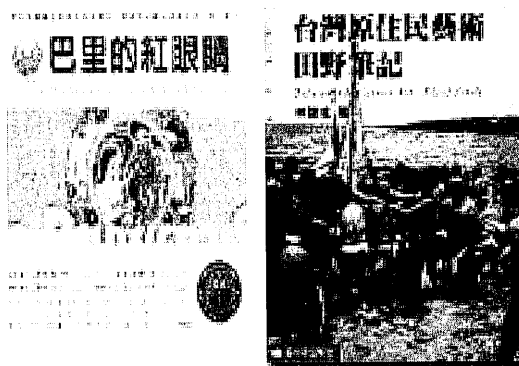
圖29 後山作家作品。

第四屆「後山文藝營」在2002年7月11到14日，於知本富野渡假飯店舉行，主題為：「中央山脈以東文學對話」。上屆討論詩人夏虹詩作，向早期筆耕有成的台東詩壇前輩致敬；本屆則邀請隱居台東多年的詩人阮囊現身說法。其他有長期關懷東部、從事影像或文字書寫的藍博州、鍾喬、白靈、路寒袖、楊渡、林黛嫻，有來自花蓮的作家陳黎、林宜霽，有來自屏東的利格拉樂·阿媽、霍斯陸曼·伐伐，和台東在地的葉香、詹澈、徐慶東、林建成、林韻梅等人，針對媒體前景與詩、散文、小說的土地特質，進行對談；會中還有胡德夫動人的即席演唱。由於課程內容豐富，授課者認真，極獲學員好評。在營務檢討會中，已決定第五、六屆的共同主題為：「文學海洋，前浪後浪」；並決定將討論的主題擴及不同的書寫面向，例