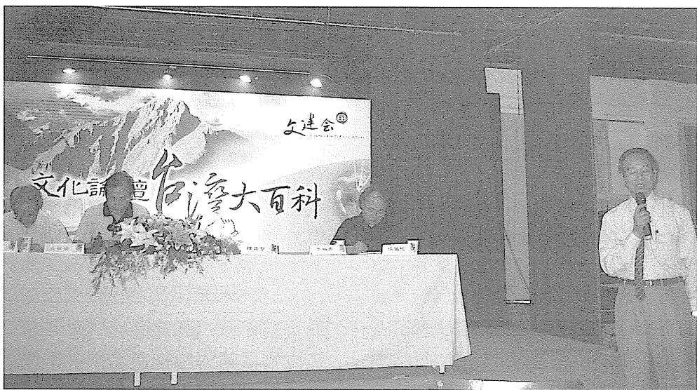
圖2 「文化論壇台灣大百科」座談會。