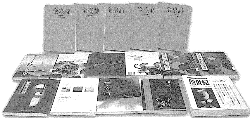
圖5 2004 台灣詩文學書影集錦。

2004 年初，一本副標題「新台灣詩選」的《啊，福爾摩沙！》出版，接著，台灣古典文學《全臺詩》首期 5 巨冊的平面紙版書與電子媒體同步推出，跟《全臺詩》可以搭配的《國國民文庫：古典文學·漢詩卷》先行推出紙版書，隨後，台灣筆會承辦「《台灣詩人選集》編輯計畫」的作業，也展開推動；下半年，《笠》詩刊歡度四十歲生日，《創世紀》詩刊也喜慶五十大壽。整整一年，由年頭貫穿年尾，彷彿一條福爾摩沙詩路隱然成形。回想十年前，1995 年某位大學教授公開說他在 1990 年之前，「不知道台灣文學是什麼？」更早，1970 年代，一位來台留學的日本碩士生，欲研究台