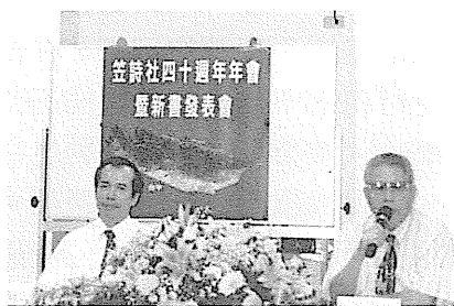
圖 7 《笠》40 週年年會。

相對於詩壇年輕浪潮的洶湧，網路園地的澎湃，創刊於 1954 年 10 月，出版《創世紀》詩刊的「創世紀」詩社，已滿 50 歲了。當年，在南台灣左營服役的三位海軍軍官張默、洛夫、痲弦，共同集資創辦《創世紀》詩刊，在 1960 年代，獨領風騷，期間出現幾次改版、停刊、重新組合，享過榮光得意，也走過低迷分裂。到 1990 年代漸趨穩定，10 月 29~30 日兩天舉行創刊五十週年連串活動，包括：「現代詩與現代藝術的對話」、「創世紀 50 年與台灣現代詩研討會」、出版慶祝詩選集《他