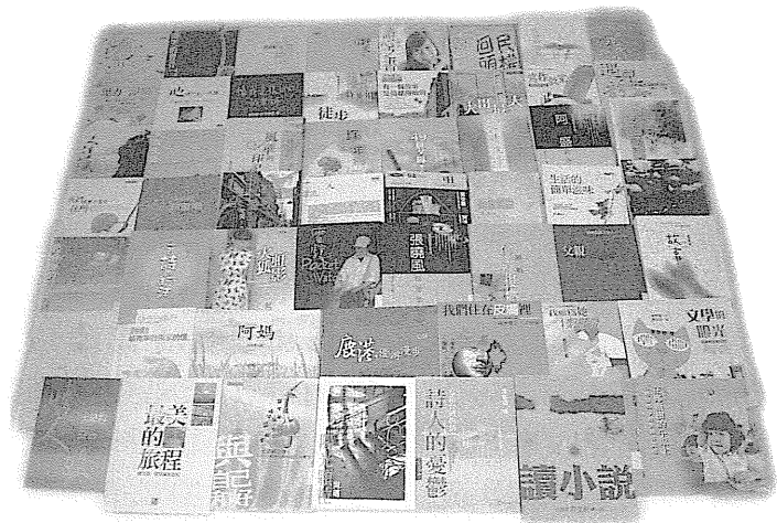
圖 8 2004 台灣散文書影集錦。