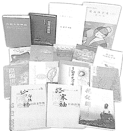
圖10 台語文學書影。