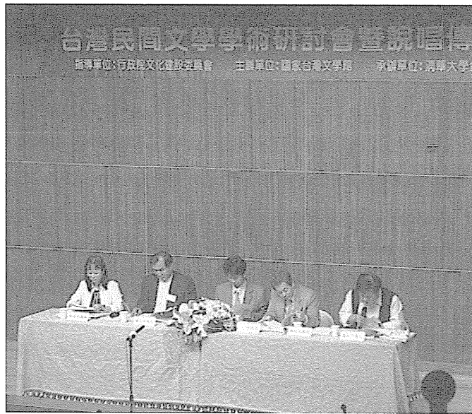
圖 15 台灣民間文學學術研討會及說唱傳承表演。

間文學」及「台灣民間文學」為兩大發展重心；其餘在一些大學院校的中文系所、台文系所、人類學系所等也有相關的課程。