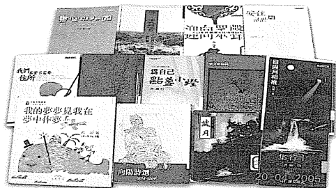
圖 33 向陽作品書影。