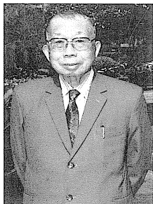
圖 54 詹 冰。

詹冰(1921.7.8~2004.3.25)，詩人。原名詹益川，苗栗人。日本明治藥專畢業。曾任藥師及國中理化教師25年。1943年留學日本期間，以現代詩〈五月〉獲日本詩人堀口大學推薦發表在詩誌《若草》，從此走入詩的世界。