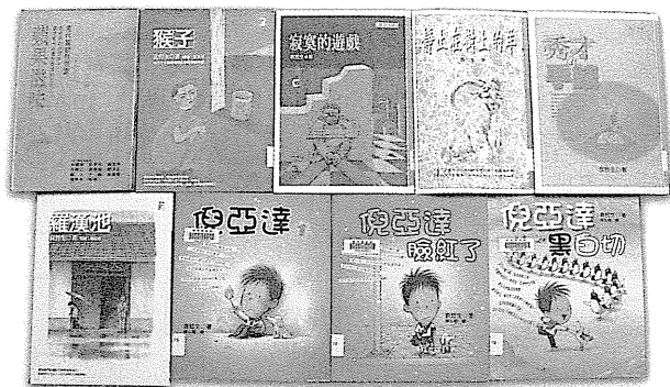
圖 57 袁哲生作品書影。