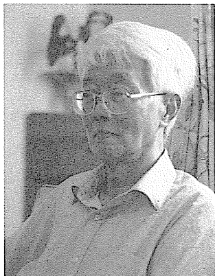
圖 60 胡秋原。

胡秋原(1910.5.5~2004.5.24)，文化評論家、政論家、編輯、主編。原名胡曾佑，又名業崇，筆名未明、石明、冰禪。湖北黃陂人。上海復旦大學中