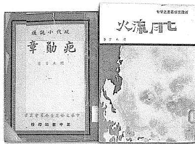
圖 67 端木方作品書影。