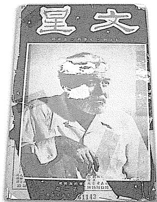
圖 69 《文星》雜誌創刊號書影。