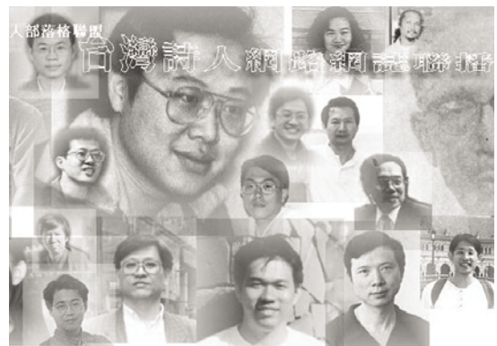
圖29 網路詩人部落格聯盟 http://blog.yam.com/taiwan_poem

由於BLOG具有功能強大的資訊交換功能，因此形成了許多大型的網路文學社群，首先利用RSS Feeding功能成立的「網路詩人部落格聯盟」（ http://blog.yam.com/taiwan_poem ），一方面聚集了百餘位詩人的BLOG的網址彙編，同時詩人在自己的BLOG張貼詩作與評論，也同時會在「網路詩人部落格聯盟」上露出標題，讓現代