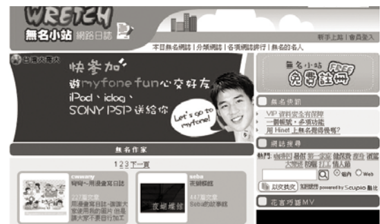
圖28 無名小站 http://www.wretch.cc/