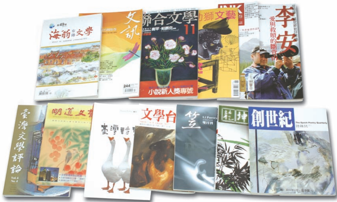
圖21 2006行政院文建會補助的優良文學雜誌。

學界之外，在這一年中，文學出版界對於台灣文學的傳播也持續盡心。12月6日，行政院文建會公布「優良文學雜誌」補助名單，獲選的雜誌共有《聯合文學》、《印刻文學生活誌》、《文訊》、《幼獅文藝》、《明道文藝》、《文學台灣雜誌》、《笠》雙月刊、《創世紀詩雜誌》、《台灣詩學》、《海翁台語文